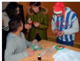
TACK för pratsunden vid pysslet!

Under tre dagar fick 80 pojkar i åldrarna 14-18 år i fängelset Targ Ocna i Rumänien uppleva lite ljus i en annars ganska dyster vardag. Rumänska fängelsemissionen fick möjlighet att glädja de unga pojkarna med sång och musik och berättelser ur Bibeln.