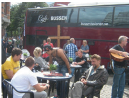
Cafébussen bjuder Livets Bröd och en fika.

Men Du kan träffa på Cafébussen på olika marknader eller på Din egen hemort, på torget eller vid köpcentret en vanlig lördag eftermiddag också.