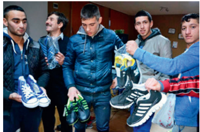
TACK för de nya skorna!

ta på fötterna. Många av dem hade bara flipflops eller trasiga sneekers utan snören och med hål, så gissa om det var en välkommen gåva! TACK, för att Du gjorde detta underbara projekt möjligt!