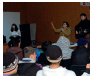
TACK för sång och musik!